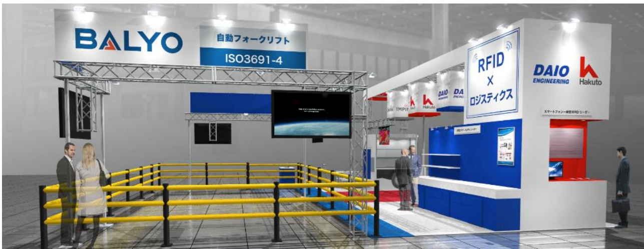
展示会場イメージ