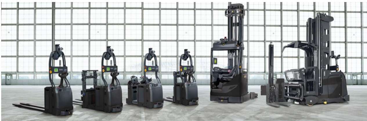
AFL 製品ラインナップ

ダイオーエンジニアリング株式会社（本社：愛媛県四国中央市）は、2024年9月10日（火）から13日（金）に東京ビッグサイトで開催される『国際物流総合展 2024』に出展します。本展示会では、「RFID×物流」をテーマに、伯東株式会社（本社：東京都新宿区）と共同ブースを展開します。ダイオーエンジニアリングは、提案・導入から保守までワンストップで提供を開始するBALYO（本社：フランス、以下「BALYO」）製の『無人フォークリフト（Autonomous Forklift, 以下「AFL」）』と、環境負荷を軽減する『紙製 RFID タグ *1 』を展示・実演します。皆さまのご来場を心よりお待ちしております。